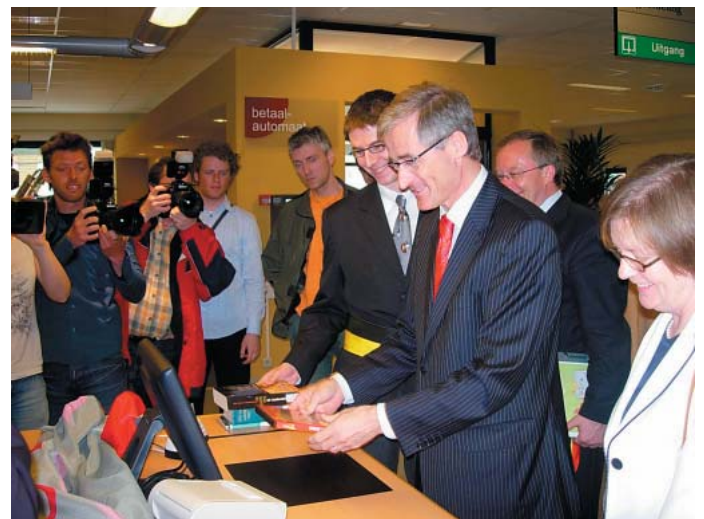
Feestelijke opening van het PBS in de openbare bibliotheek van Avelgem in aanwezigheid van minister Geert Bourgeois.

tie van nieuwe bibliotheken is gebaseerd op de huidige automatisering van de bibliotheken en de leeftijd van hun hard- en software. Zo wordt voorrang gegeven aan bibliotheken die werken met Vubis Original omdat dit product steeds minder ondersteund wordt. Voorts wordt gekeken naar de inspanningen die de bibliotheek kan leveren aan de verbetering van de kwaliteit van de beschrijvingen in het PBS, de betrokkenheid binnen Winob, de ambities van de bibliotheek en de mate van hoogdringendheid. Op basis van ervaringen en bevindingen tijdens de pilootfase heeft de provincie ook de aanpak van de instap gewijzigd. Zo vraagt ze van elke geselecteerde bibliotheek alvast een officiële bevestiging van kandidaatstelling.