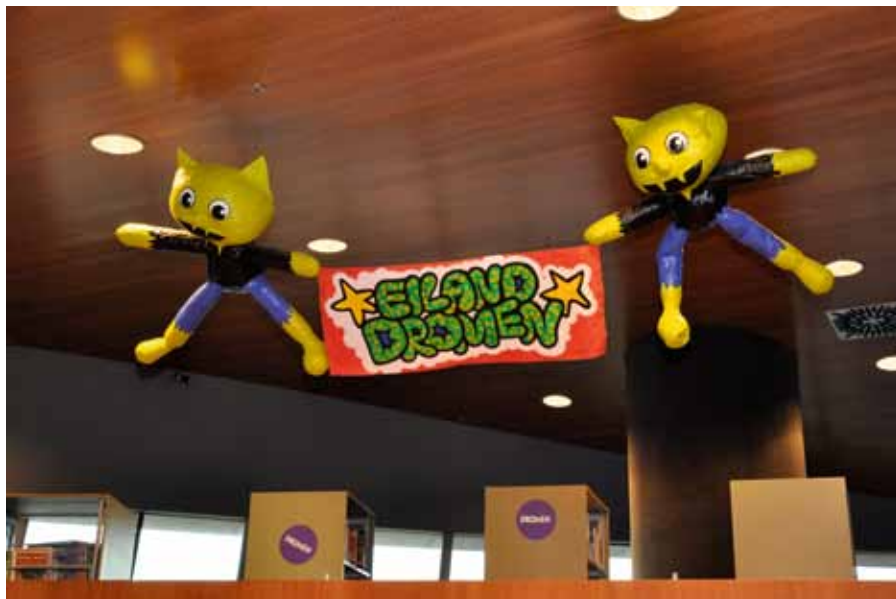
Openbare bibliotheek Heerhugowaard.

“ ONDERZOEK NAAR DE OPBRENGSTEN VAN BIBLIOTHEKEN WORDT NAMELIJK VOORAL NOG GEBRUIKT VOOR HET VEILIGSTELLEN VAN SUBSIDIE EN VEEL MINDER VOOR EEN KRITISCH GESPREK OVER WAT BIBLIOTHEKEN DOEN EN HOE (GOED) ZE DAT DOEN.