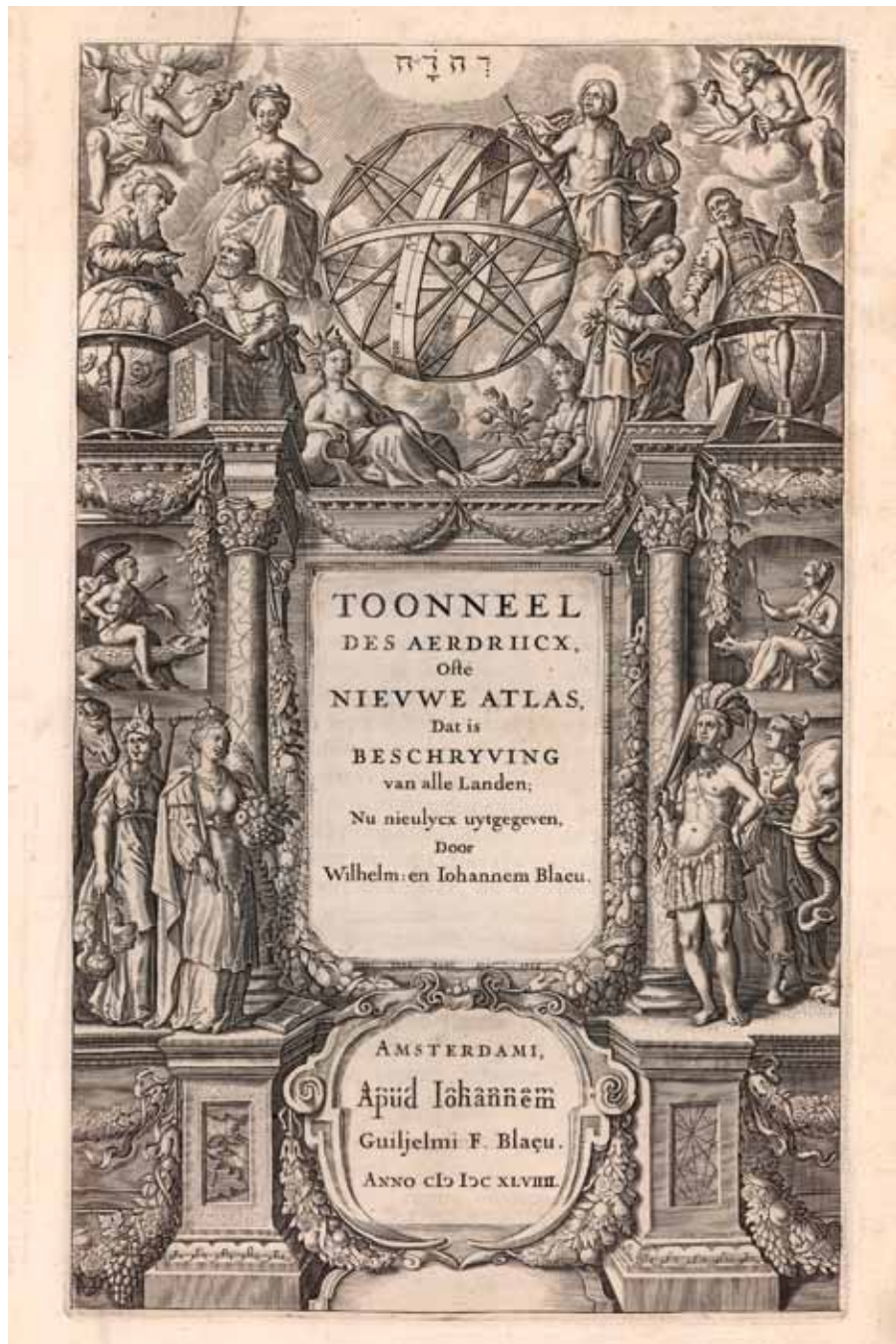
De rijkelijk versierde titelpagina van het eerste deel van Toonneel des aerdrickx, ofte Nieuwe atlas, dat is beschryving van alle landen, in 1649 uitgegeven door Willem en Joan Blaeu.