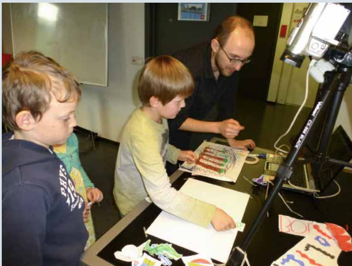
In een aantal bibliotheken konden kinderen hun eigen animatiefilmpjes maken.