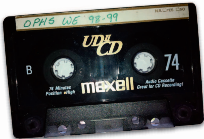
“Great for CD recording!”