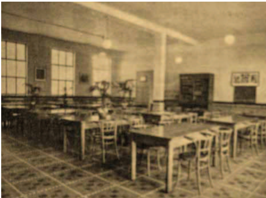
De leeszaal van de bibliotheek in de openbare bibliotheek van Hoboken anno 1933.

Onder het fenomeen 'openbare bibliotheek' wordt in de studie een bibliotheek