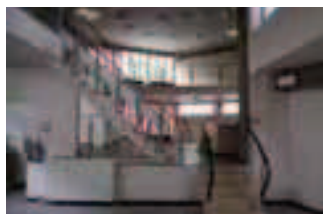
De vroegere openbare bibliotheek op Zurenborg (gesloten in 2011).

Met een schets van de historische ontwikkeling van de openbare bibliotheken in de provincie Antwerpen gaat de studie dieper in op zes openbare bibliotheken uit het stedelijke bibliotheeknetwerk van de stad Antwerpen waarbij de focus ligt op de bouwfase en/of eerste verbouwingen ervan. De stad Antwerpen was immers bij de eerste lokale overheden die in 1866 zelf een openbare bibliotheek oprichtte als aanvulling op de bestaande stedelijke bibliotheek en vanaf 1911 bijkomende filialen uitbouwde. In de eerste nummers van de Bibliotheekgids , het tijdschrift van de toenmalige VVBAD, werd een reeks over de openbare bibliotheken in België gestart. Enkel voor de stad Antwerpen werd echter effectief een overzicht gepubliceerd, wellicht onder stimulans van de drijvende figuren achter de vereniging. Een boek van de onderbibliothecaris A. Moons gaat in 1924 uitgebreid in op de ontwikkeling van het fenomeen.