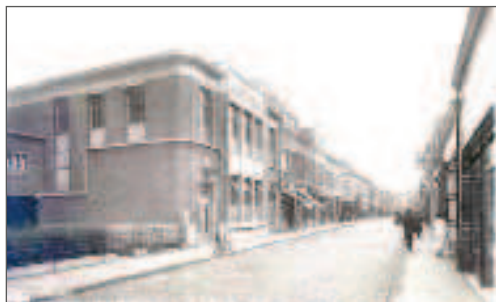
De vroegere hoofdbibliotheek van Hoboken.