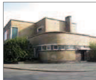
De vroegere bibliotheek op de Luchtbal.

De Wet Destrée uit 1921 spreekt enkel over een "dege-lijk" lokaal dat "toegankelijk" moest zijn. 4 De interpretatie van de wet werd overgelaten aan de oprichters van de openbare bibliotheken.