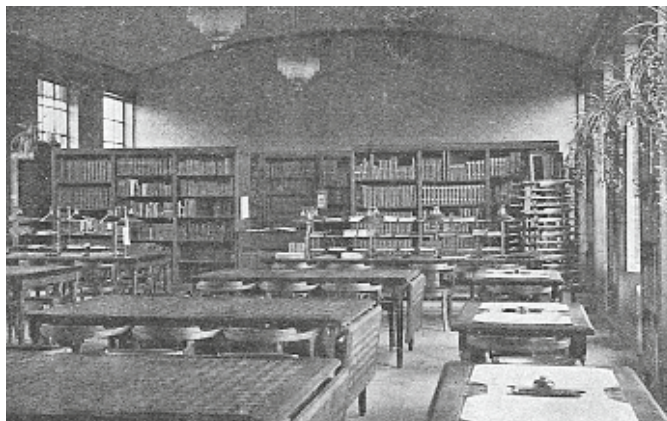
De leeszaal van de centrale bibliotheek van de stad in de Blindestraat.

Sinds della Santa's driedelige indeling — boeken,