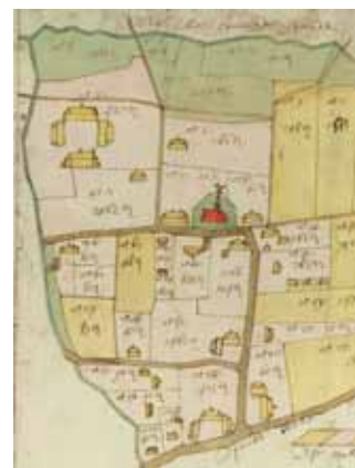
“ Metynck- ende caerteboeck ”, landboek met kaarten van Dikkele, opgemaakt door de landmeter Philippe De Clercq, 1766.

diachrone studie mogelijk van de evolutie van het grondbezit en grondgebruik, de bevolking, de plaatsnamen en het landschap. Zeker als ook de bijhorende kaarten bewaard zijn gebleven, kunnen we op die manier het (leven op het) Vlaamse platteland van de 17e en 18e eeuw zichtbaar maken.