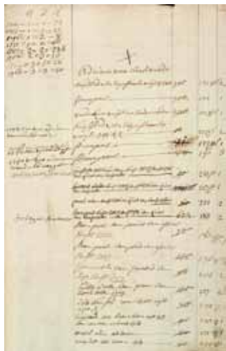
“ Taeffelbouck ”, gebruikboek van Opbrakel, 1741-1773.

Bij het Rijksarchief is een studie verschenen van de landboekhouding in het graafschap Vlaanderen. Deze publicatie vertrekt vanuit een contextuele analyse van landboeken. Dit onderzoek vormt de basis van een bronnentypologie, die de verbanden blootlegt in de heterogene verzameling archiefbescheiden die betrekking hebben op de registratie van onroerende goederen. Veel aandacht gaat ook uit naar de administratieve gewoonten die mee vorm gaven aan deze leggers en registers. Een grondige contextualisering bleek noodzakelijk om inzicht te krijgen in de rijke variatie aan formele titels; een verfijning van de bestaande archiefterminologie drong zich op.