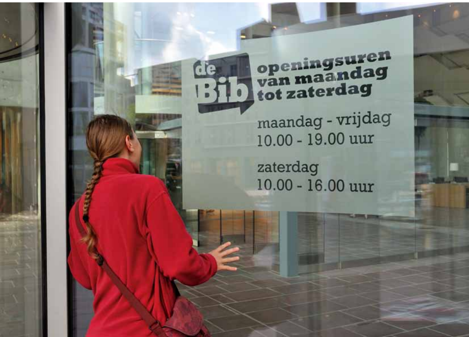
Bibliothecarissen zijn niet altijd op de hoogte van de bestaande privacywetgeving.

en het verstrekken van gegevens aan derden (14 procent). Het is zorgelijk dat slechts 8 procent organisatorische en technische maatregelen heeft genomen om de opslag en verwerking van persoonsgegevens te beveiligen. Amper 7 procent van de bibliotheken heeft een precieze doelstelling voor de verwerking bepaald en afspraken gemaakt over de wijze van informatieverstrekking aan de bibliotheekgebruiker. 6 procent heeft een bewaartermijn bepaald voor de opslag van de verzamelde gegevens. Slechts een vijfde van de respondenten die over een privacybeleid beschikken, hebben iemand aangesteld