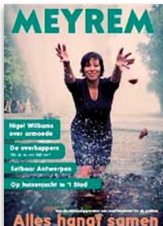
Patrick Janssens en Meyrem Almaci brachten een eenmalig tijdschrift uit tijdens de campagne voor de gemeenteraadsverkiezingen 2012 in Antwerpen.

veel bezoekers naar zijn website 2 . Partijgenoot Philip Heylen aanhoorde dezelfde arrogante Hollander op de panoramaverdieping van het MAS 3 . Gerolf Annemans haalde voor zijn filmpje niet alleen inspiratie bij Marc Van Peel, maar ook bij Bob Dylan 4 . De VRT organiseerde zelfs een actie waarbij lokale kandidaten hun filmpje konden opladen op de VRT-website. Voornamelijk districtskandidaten maakten hier gebruik van.