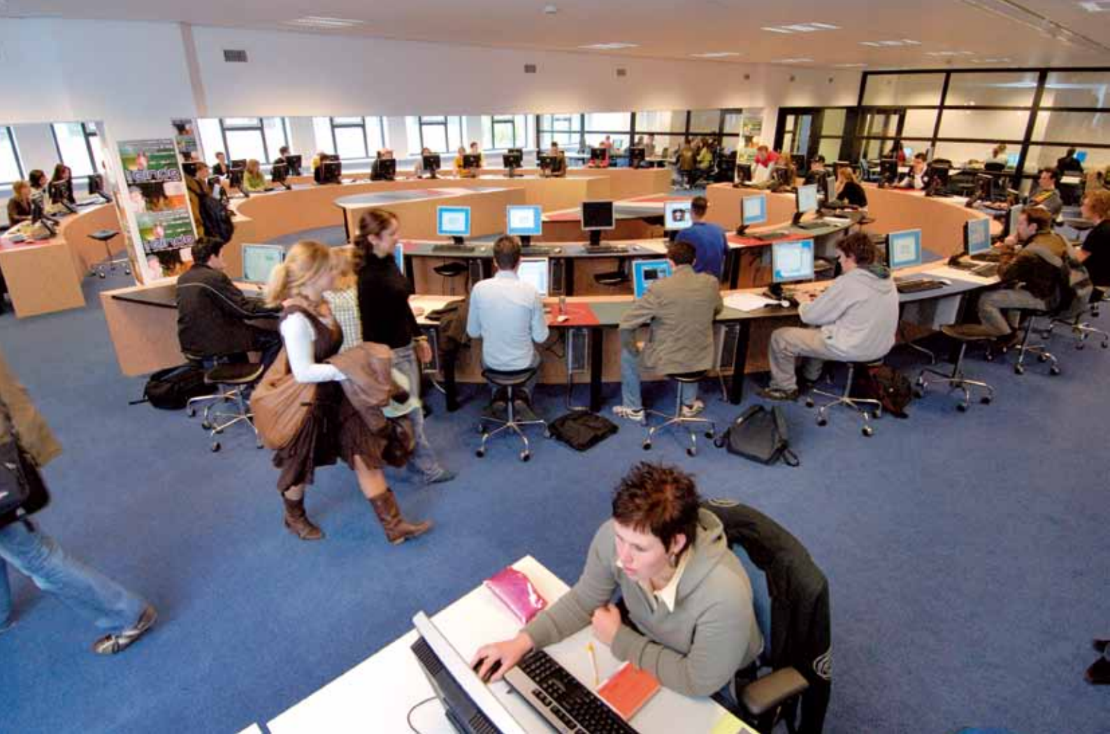
Het leercentrum Xplora in het hart van de hogeschool.