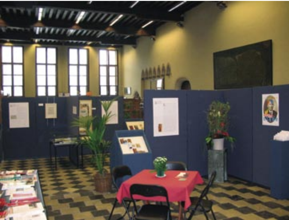
Stadsarchief Brugge tijdens de Erfgoeddag 2006.

“ In het nieuwe Erfgoeddecreet dat op dit moment binnen de Vlaamse regering besproken wordt, zijn archieven, musea en erfgoedbibliotheken gedefinieerd als ‘erfgoedinstelling’.