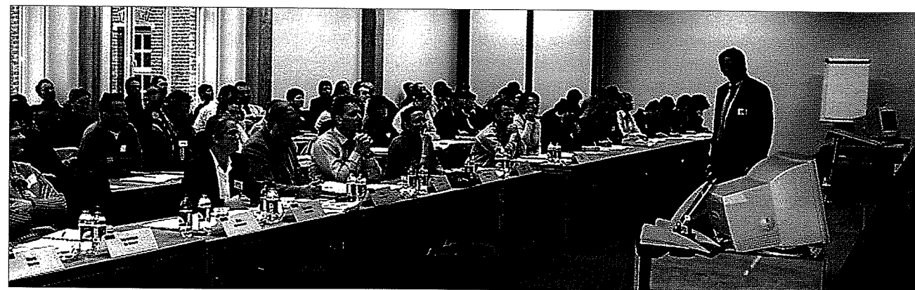
Deelnemers aan de succesvolle studiedag over kennismanagement.