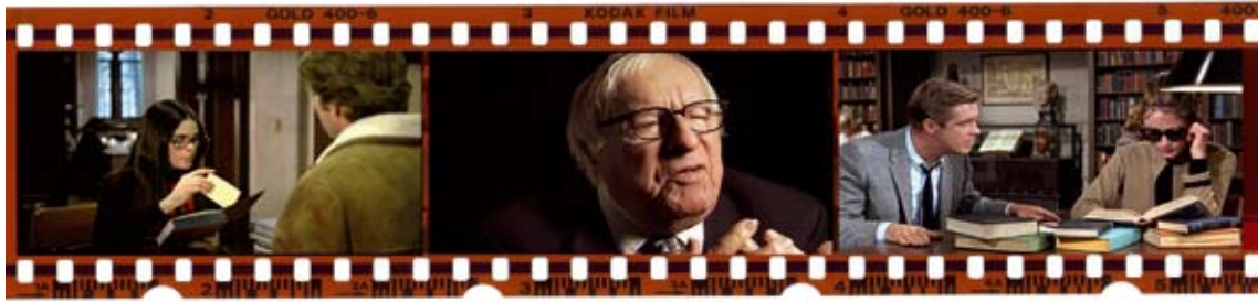
Vlnr.: Love Story , Ray Brad , Breakfast at Tiffany's .

len, verwerken en verzetten van stapels en riemen papier waarbij het lachen je vergaat, maar waar geen mens nog van opkijkt omdat het nu eenmaal deel uitmaakt van het totaalbegrip dat 'ambtenarij' en 'bezigheidstherapie' heet.