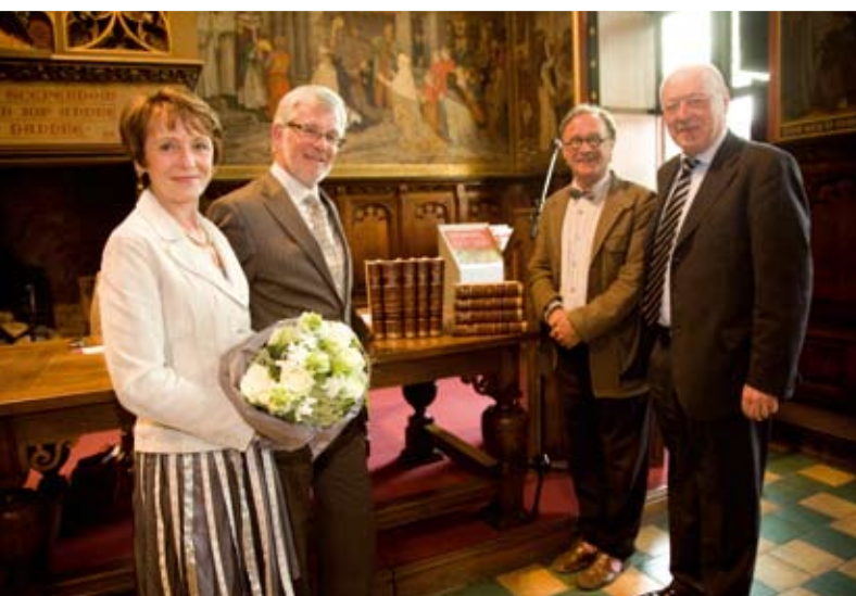
Boven: met vrouw en kinderen in de Schepenzaal van het Brugse stadhuis. Onder: na de overhandiging van het boek.