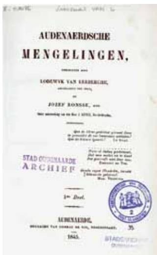
Titelblad van het eerste deel van de Audenaerdsche Mengelingen uit 1845. (Collectie SAO).

beschouwde hij als een hulpwetenschap van de geschiedenis. Archivaris Van Lerberghe ordende niet alleen het oud archief maar publiceerde het ook in een zesdelige reeks Audenaerdsche Mengelingen die verscheen tussen 1845 en 1855. De publicatie van de archiefstukken was volgens hem verantwoord aangezien het ging om “een schat van belangrijke oorkonden en bijdragen voor de plaatselijke en daardoor zelfs voor ‘s lands geschiedenis” 13 .