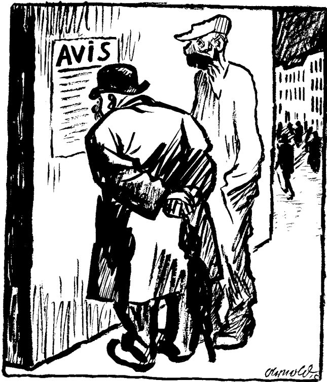
Burgerman en arbeider... beide even aandachtig. Een tekening van een Duits soldaat.