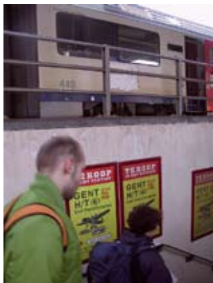
'Gent H/T' in station Gent Sint-Pieters 2003.