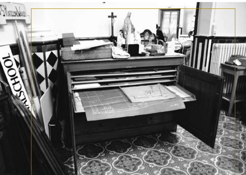
Plannenladenkast in de archiefruimte van de Zusters Urselinen te Onze-Lieve-Vrouw-Waver.

Periodieke cultureel-erfgoedpublicaties kunnen structurele ondersteuning ontvangen en eenmalige publicaties kunnen een beroep doen op projectfinanciering, maar niet als ze uitgegeven worden door een organisatie die op basis van dit decreet structureel gesubsidieerd wordt.