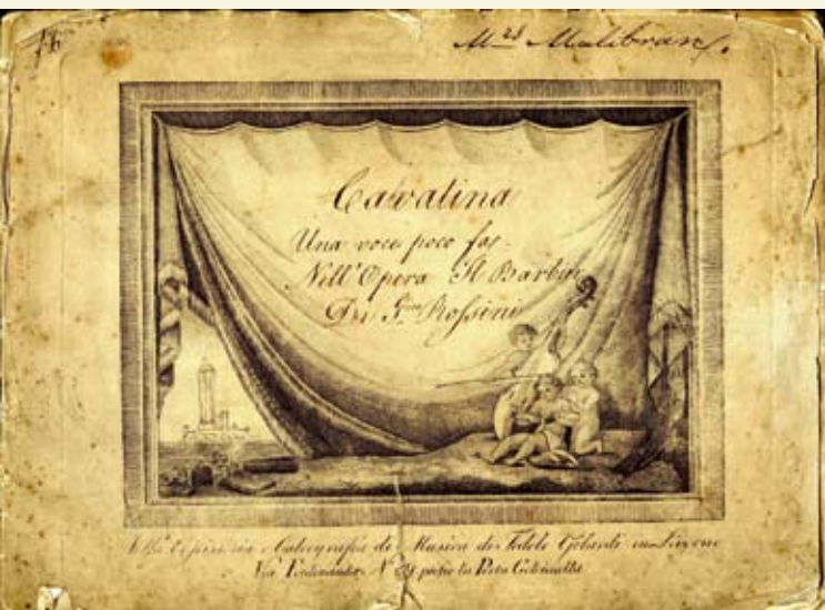
Cavatina uit Il Barbiere di Siviglia van Rossini. Muziekhandschrift uit de verzameling van de mezzosopraan Maria Malibran.

De groeiende professionalisering van het bibliotheekwezen ging ook in het conservatorium niet ongemerkt voorbij. De bibliotheek werd niet langer geleid door een kunstenaar, in casu een musicus, maar door een musicoloog. In combinatie met de ontwikkeling en de bloei van de muziekwetenschap leidde dat in de loop van de 20ste eeuw tot een fundamentele verschuiving in het aankoopbeleid: waar in de 19de eeuw de collectie bijzonder sterk gericht was op bladmuziek ten behoeve van de uitvoerende musicus, gaven de musicologen-bibliothecarissen nu ruime aandacht aan wetenschappelijke literatuur over muziek. In combinatie met terugvallende budgetten ging dit soms ten nadele van de collectie bladmuziek, maar kritiek hierop bleef vrij beperkt 7 .