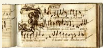
Tenorpartij van een madrigaal, muziekhandschrift, Italië, 16de eeuw. B Bc 27.511

François Joseph Fétis 1 zag het duidelijk anders. Ondanks de voortdurende beperkte financiële middelen, niet zonder verbetering en met wisselend succes over de jaren heen, slaagde hij erin om de basis te leggen van een volwaardige muziekverzameling.