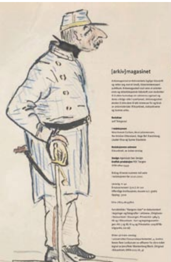
Inhoud van Arkivmagasinet (2006) 2.

Zoals blijkt uit een bijdrage in de rubriek Notiser (Notities) in het tweede nummer ( Arkivsenter i Trondheim. Tre arkiv og et bibliotek under et tak , (2006) 2; p. 40), werd die laatste beleids optie al deels verwezenlijkt in het pas opgerichte Arkivsenter (hier zou dat nu wellicht 'erfgoedcentrum' gedoopt worden) in Trondheim (de tweede grootste stad van Noorwegen). Het bevat drie archieven en één bibliotheek: het Statsarkiv (het stadsarchief), het gewestelijk archief voor Trøndelag (d.i. een historisch landschap, nu verdeeld over twee provincies), naast de spesialsamlinger (bijzondere collecties) van de Universiteitsbibliotheek van Trondheim. Deze vier instellingen delen dezelfde leeszaal, naast alle faciliteiten voor de gebruiker (zoals een café). Ook de musea uit Trondheim tonen interesse voor deelname aan deze 'cultuurbunker' (de bijnaam verwijst naar de tijdens de Tweede Wereldoorlog door de Duitse bezetter gebouwde bunker Dora waarin het Arkivsenter gehuisvest is). Een andere 'notitie' betreft het onderzoek naar het gebruik van archief voor de eindverhandelingen van studenten geschiedenis aan de universiteit van Oslo van 1908 tot 2004. Dat leverde soms verrassende resultaten op (Øyvind Ødegaard, Historiestudentenes bruk av utrykte arkivkilder , (2006) 1;