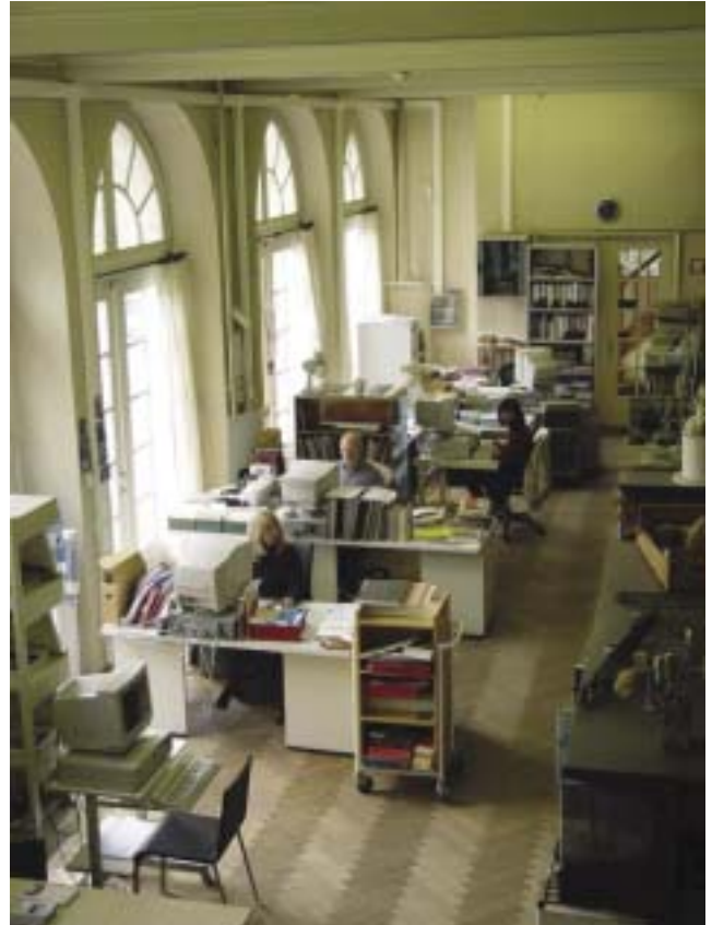
Het interieur van de 'Middelheimbibliotheek'.

idealen en praktische vaardigheden binnen de Arts & Crafts Movement treft hem zeer. "Echter, jullie weten ook dat hij ondanks zijn socialistische overtuiging en strijd er zelf nooit in slaagde voorwerpen te maken voor de gewone man: zijn meubels, textiel, glas, alles was maar betaalbaar voor de rijke klasse. Ook de boeken van de 'Kelmescott Press' waren en zijn onbetaalbaar. Maar hij heeft natuurlijk een aanzet gegeven voor het maken van boeken met een grote ambachtelijkheid en eerlijke materialen. En dat had zijn gevolgen in het Verenigd Koninkrijk, Duitsland, Nederland en Vlaanderen (Van de Velde, J. de Praetere...)" .