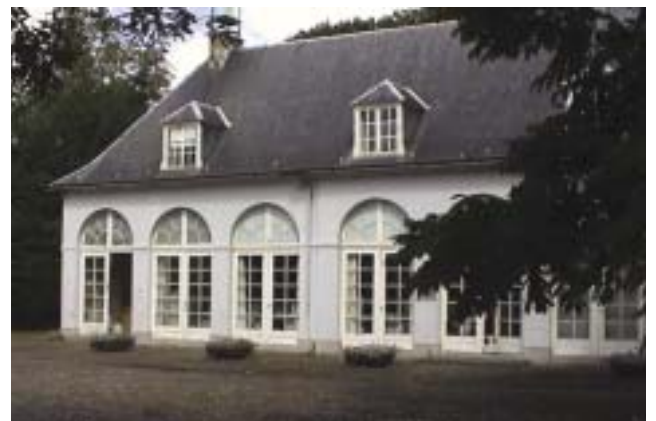
Het documentatiecentrum van de 'Middelheimbibliotheek', ondergebracht in de orangerie.