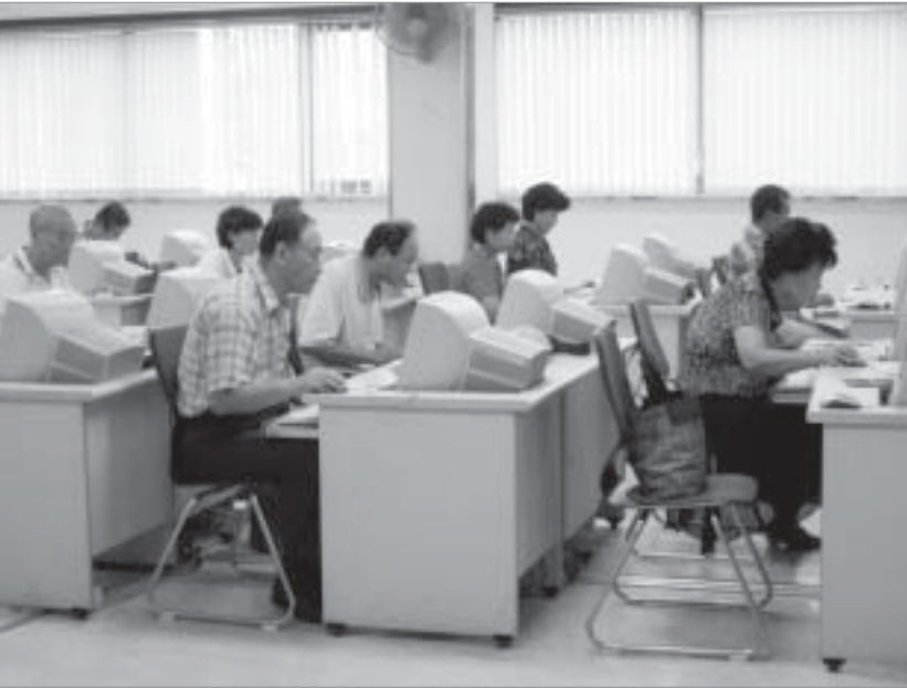
Levenslang leren is ook in Korea een 'hot item': in het Mapo Lifelong Learning Center komen dagelijks 6.000 mensen over de vloer om een brede waaier van kennis te vergaren: op de computer leren werken maar ook pottenbakken en fitness zijn er mogelijk en er is zelfs een bibliotheek (of drie).