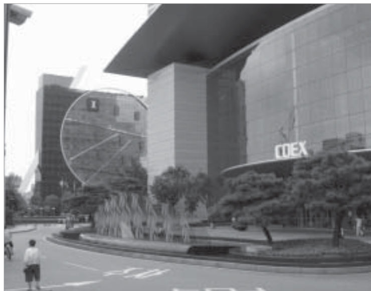
Het IFLA-congres 2006 had plaats in dit supermoderne CO-EX conferentiegebouw in een zakenwijk van Seoul: meer dan de helft van de 4000 deelnemers waren Aziaten.

De deelnemers kwamen uit 117 verschillende landen. België had 11 vertegenwoordigers naar Seoul gestuurd: 9 Vlamingen en 2 Franstaligen. Vlaanderen had vertegenwoordigers van de Vlaamse overheid, de KBR, het VCOB, de K.U.Leuven en uiteraard ook de VVBAD. De Vlaamse vertegenwoordiging was hiermee precies even groot als die van landen als Litouwen en Kroatië. Wij konden bijlange na niet tippen aan delegaties uit de Scandinavische of Angel-