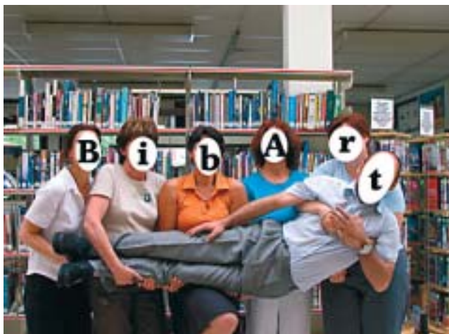
Logowedstrijd "BibArt zoekt gezicht" (Interlokale vereniging BibArt).