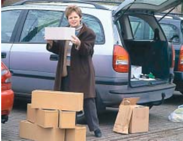
Meelijeslandse AVM-wisselcollectie (Samenwerkingsverband Meelijeslandse bibliotheken).