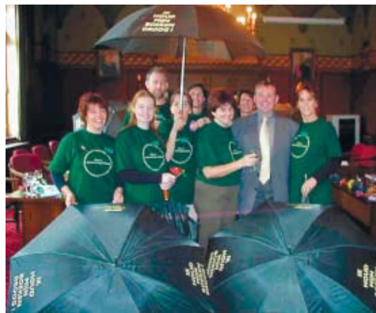
Paraplu-project (Samenwerkingsverband ZOVLA)

Intussen zijn we begin 2006 en telt Oost-Vlaanderen 1 projectvereniging (CultuurOverleg Meetjesland), 5 interlokale verenigingen (BibArt, De Leerdijk, Route 42, Vlaamse Ardennen en ZOVLA) en maakt het samenwerkingsverband Biblio-Waas (regio Waasland) sinds 25 november 2005 deel uit van het Intergemeentelijk Samenwerkingsverband Land van Waas (ICW) dat een dienstverlenende vereniging is. Enkel het samenwerkingsverband ZES (regio Gent-rand) heeft nog geen plannen voor een verdere formalisering.