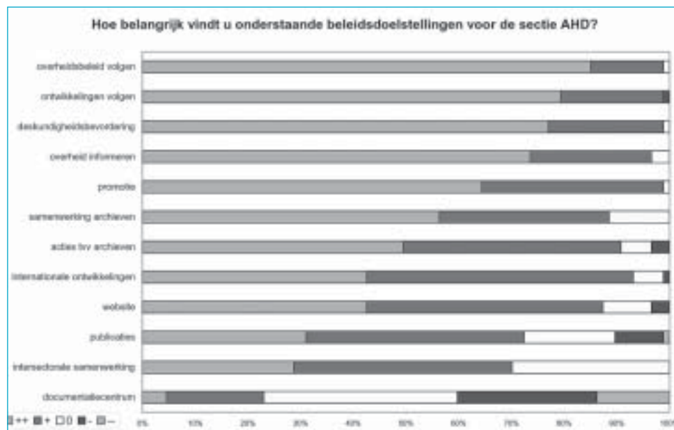
Grafiek 2: het belang van beleidsdoelstellingen voor de sectie AHD.

Een berekening op basis van de opgegeven prioriteit