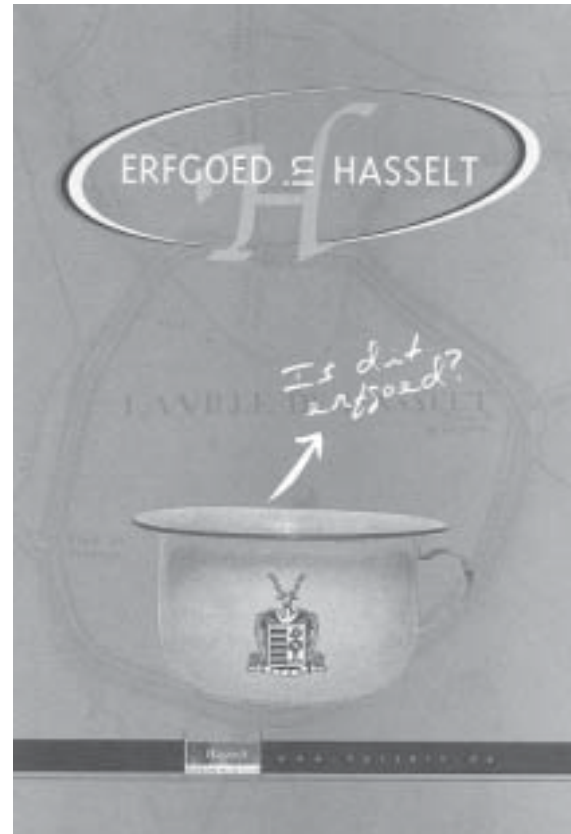
Kaft van de erfgoed-brochure in Hasselt, het resultaat van een eerste samenwerkingsverband.