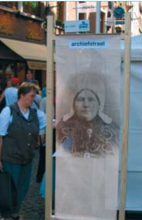
Archiefstraat op Erfgoeddag 2005. Foto: Bruno Vermeeren.