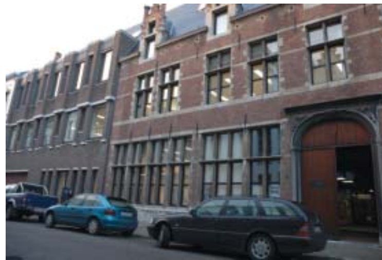
De voorgevel van de Universiteitsbibliotheek Antwerpen in de Prinsstraat.