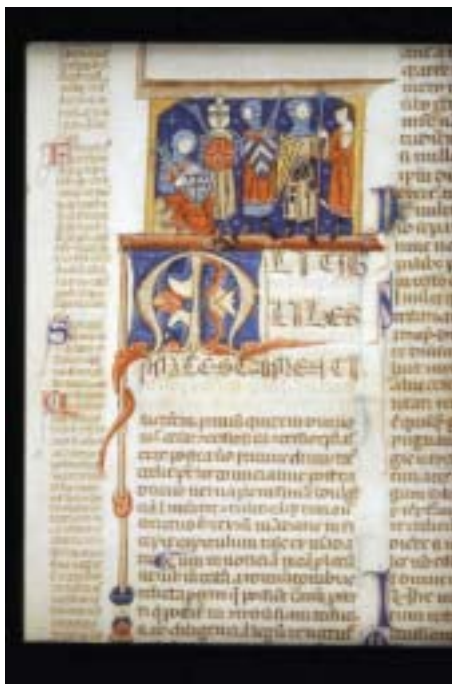
Justinianus, Infortiatum, met glossen van Accursius, 13de eeuw (Openbare Bibliotheek Brugge, ms. 352)

Een meervoudig depot, zoals dat in de meeste Europese landen – en niet alleen die met een federale staatsstructuur – bestaat, heeft het voordeel van een grotere (bibliografische) dekking én een verdubbelde fysieke overlevingskans van het patrimonium.