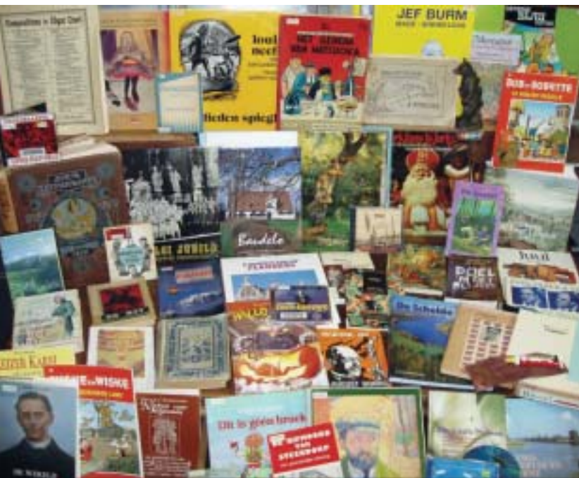
Bibliotheca Wasiana, bio-bibliografisch documentatiecentrum van het Land van Waas.

collectiestukken van niet-Vlaamse origine vereisen dezelfde zorg als Vlaams erfgoed als het gaat om preservering, conservering en restauratie, om de bibliografische ontsluiting en de beschikbaarstelling ervan. Alleen als het gaat om digitalisering vereist erfgoed van Vlaamse origine de bijzondere zorg van de Vlaamse Gemeenschap – en de andere betrokken overheden – met het oog op een globaal beleid ten aanzien van digitalisering van Vlaams erfgoed, zowel binnen als buiten de grenzen.