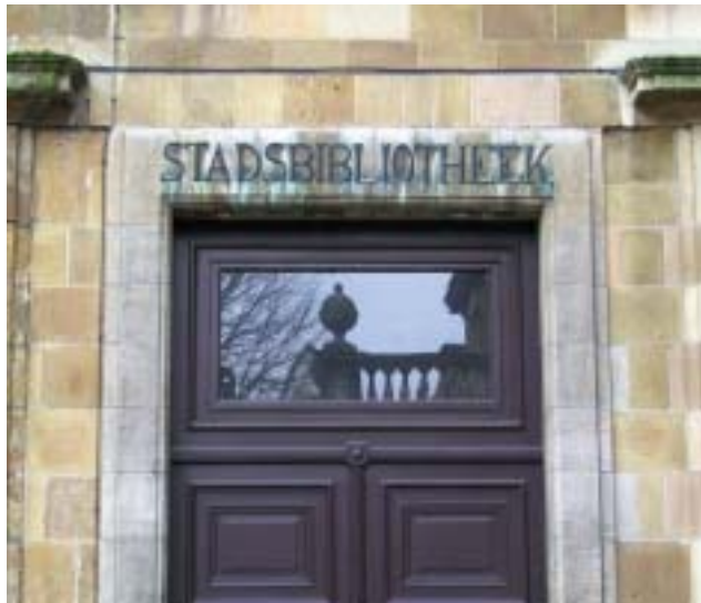
De Stadsbibliotheek van Antwerpen.

De SBA bezit nagenoeg een miljoen volumes boeken en tijdschriften, en bestrijkt daarmee ongeveer 36 kilometer rek. Zwaartepunten zijn, in trefwoorden samengevat: Nederlandse letterkunde, geschiedenis van de Nederlanden, kunst in de Nederlanden, volkscultuur in Vlaanderen, oude drukken en boekgeschiedenis, Antverpiensia.