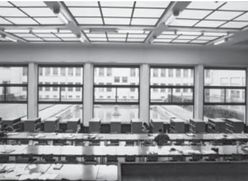
De grote leeszaal van de Universiteitsbibliotheek Gent.

Het wordt belast met restauratietaken die de in de regio's aanwezige deskundigheid overstijgen. De personele en logistieke implicaties hiervan moeten nader worden uitgewerkt. Samenwerking met de afdeling Conservatie en restauratie aan de Hogeschool Antwerpen, waarvan de specialisatie Papier (in feite papier en boek) in Vlaanderen enig in haar soort is, ligt hier voor de hand. Competentie op dit terrein is in Vlaanderen schaars, onder meer door het verdwijnen van het Gentse Hicoreb. Vervolg- en bijscholingsopleidingen in het buitenland moeten dan ook tot de mogelijkheden behoren, allereerst voor de medewerkers van het centrale restauratieatelier. Het bovengenoemde coördinatiecentrum stelt de competentie en de doorgedreven expertise van het centrale restauratieatelier ter beschikking voor advisering op het vlak van preservatie, conservering en restauratie. Reeds elders aanwezige expertise (consulenten, cel Behoud en beheer van de Stad Antwerpen...) wordt daarbij optimaal benut.