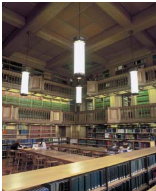
Universiteitsbibliotheek Leuven.

Uitzonderingen kunnen worden overwogen voor databanken die inhoudelijk aansluiten bij het Vlaamse erfgoedbeleid, zoals de online publicaties van het Centrum voor Teksteditie en Bronnenstudie van de Koninklijke Academie voor Nederlandse Taal- en Letterkunde (een voorbeeld: de Inventaris van de muziekbibliotheek van Jan Baptist Benoit