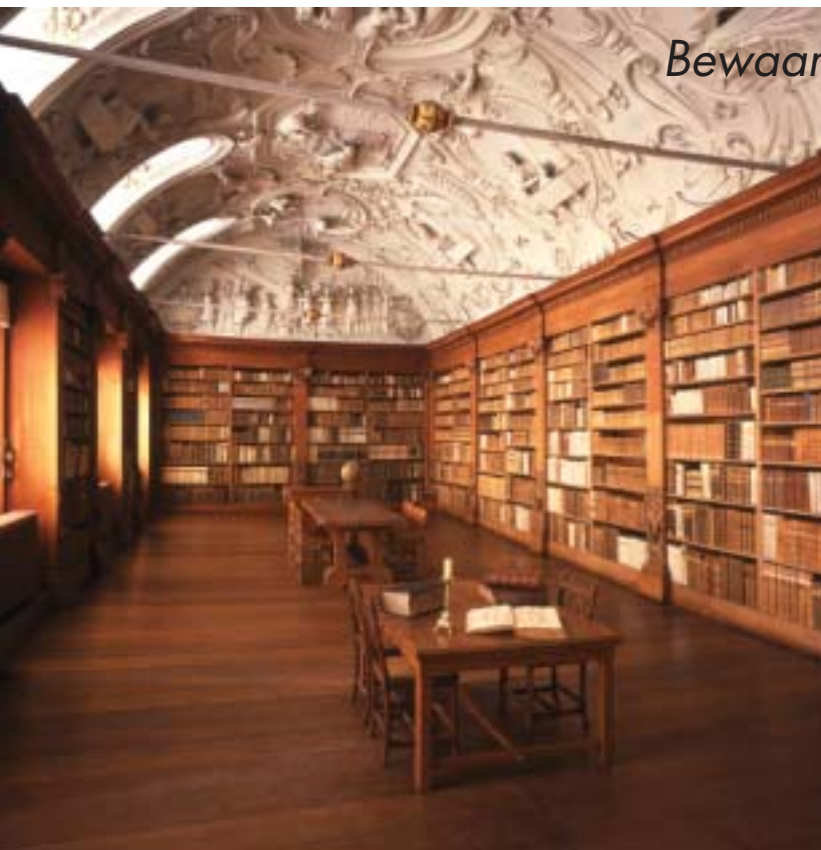
Bibliotheek van de Abdij van Park in Heverlee.