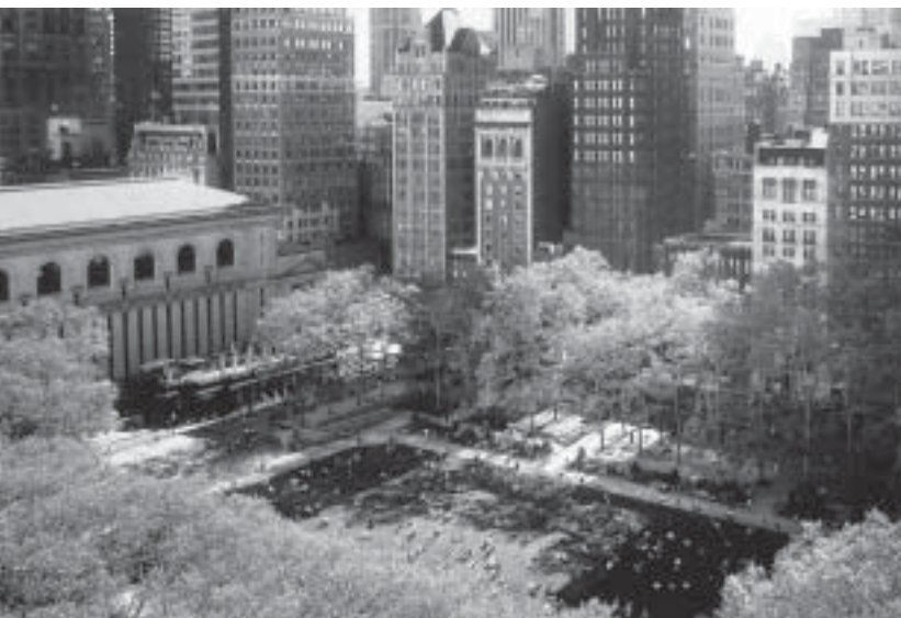
Bryant Park met links de New York Public Library.

Aansluitend verzamelden de 700 deelnemers voor de Welcome Cocktail Party in de luxueuze 'Terrace Suite'. Ik zag er al snel heel wat (Europese) bekenden.