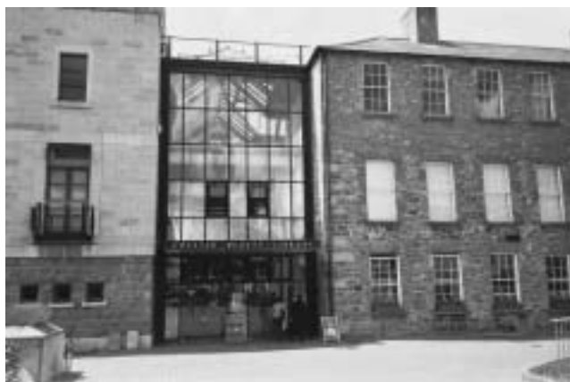
Onder: Chester Beatty Library. Rechts: Ingang van de National Library in Dublin.

Bruno Vermeeren , beleidsmedewerker VVBAD bruno.vermeeren@vbad.be