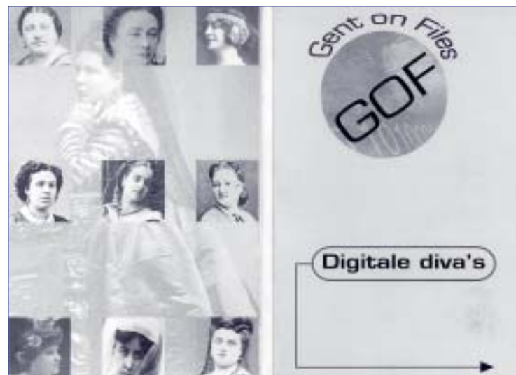
Mapje met postkaarten van 'digitale diva's', dat verkocht werd om geld in te zamelen voor het digitaliseren van de albums met foto's van de Gentse opera (1848-1924).

Erfgoed en alle acties errond kunnen de betrokkenheid van de burger bij al wat gebeurt in zijn gemeenschap sterk in de hand werken. Deze betrokkenheid is een middel tegen sociale uitsluiting en als dusdanig een element in het behoud van een democratische samenleving. Deze acties kunnen bijdragen tot een beter begrip van de maatschappij. Ze kunnen echter ook leiden tot het zich toe-eigenen van de geschiedenis. De betrokkenheid stimuleren, de gehechtheid aan het eigen erfgoed democratisch benutten zonder chauvinisme en met de bedoeling een 'veelzijdig' beeld van het verleden te geven, daartoe kan een vriendenkring op maatschappelijk vlak bijdragen.