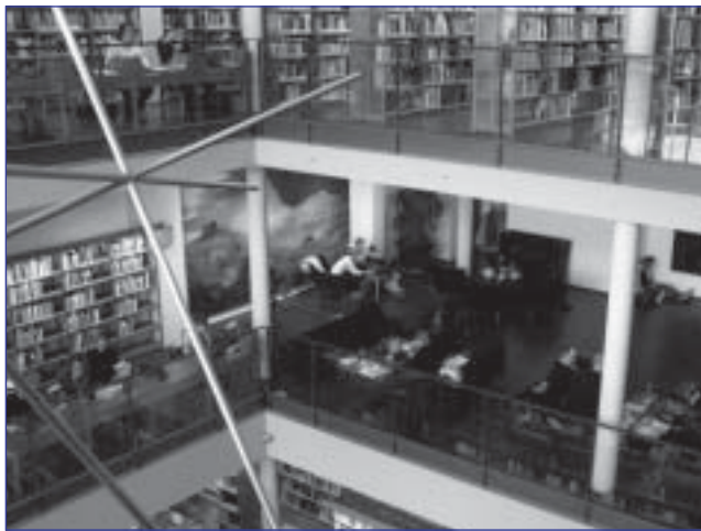
Ook in de Business School Library is kunst geïntegreerd.

De Copenhagen Business School is de derde grootste universiteit van Denemarken met meer dan 14.000 studenten en is één van de 12 Deense en Zweedse universiteiten die samen de transnationale Öresund universiteit vormen met ruim 120.000 studenten. Deze Business School heeft twee deelbibliotheken: de Economische bibliotheek (inclusief het Learning Resource Center en de leeszaal) en de Taalbibliotheek. Deze indeling is gebaseerd op de twee faculteiten: de economische faculteit en de faculteit moderne talen. De deelbibliotheken worden geleid door één bibliotheekmanagement. Er zijn 55 personeelsleden (FTE) en er wordt ook een beroep gedaan op jobstudenten.