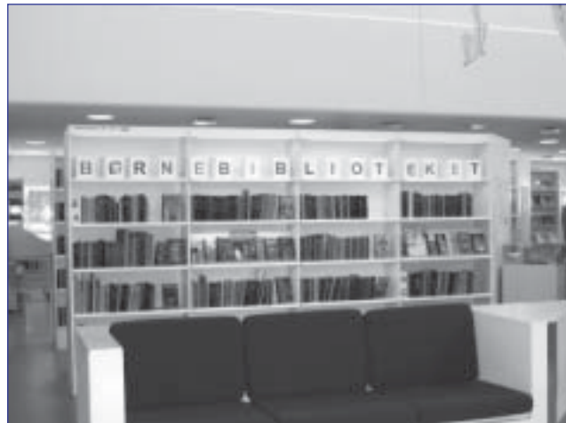
Blokjes vormen het Deense woord voor kinderbibliotheek.

Tijdens de introductie worden de cijfers nog maar eens op tafel gegooid. Een hoog jaarlijks budget, een oppervlakte van 7300 m 2 , meer dan 100 personeelsleden, 760.804 bezoekers per jaar en 1,45 miljoen uitteningen. "It's quite a lot", noemt de bibliothecaris dit dan bescheiden. Opvallend is ook het aantal IBL-aanvragen. Denemarken heeft een goed uitgewerkt net van interbibliothecair leenverkeer en de aanvragen voor de bezoekers zijn gratis. Het hoeft dan ook niet te verbazen (al blijft het indrukwekkend) dat er meer dan 70.000 aanvragen per jaar worden geteld voor de regio Kopenhagen alleen. Veel energie gaat naar de virtuele bibliotheek en het snijpunt tussen de virtuele en de fysieke bibliotheek. Op dit moment lopen er verschillende projecten. Zo is er de Phonofile , waar leners online muziek kunnen downloaden voor een beperkte periode, de Bibliotheeksvagten waar je vragen kan stellen aan een bibliothecaris ( ask a librarian ) en de kinderversie ervan ( Spørg Olivia ).