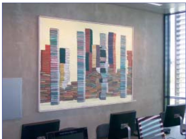
Kunst is geïntegreerd in de Deense bibliotheken, zo ook in de Roskilde Universiteitsbibliotheek.