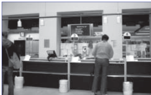
Bibliotheekgebruikers trekken een nummer aan de inlichtingenbalie.

Daarnaast is de Kopenhaagse openbare bibliotheek een koploper inzake het on line uitleen van e-boeken, merendeels Deense fictie. Ook al laten de uitleenstatistieken vermoeden dat het grote publiek de weg naar de digitale roman nog niet geheel gevonden heeft, toch blijkt een soortgelijk pilootproject, waarbij gedigitaliseerde non-fictiewerken, voornamelijk ICT-literatuur, tot één maand lang uitgeleend en in sommige gevallen zelfs geprint kunnen worden, goed aan te slaan. Zo goed zelfs dat de overheid deze dienstverlening tegen de zomer van 2005 wil uitbreiden naar alle openbare bibliotheken in Denemarken. Een vierde, meer beproefde en door het publiek fel gesmaakte formule van elektronische dienstverlening is gebaseerd op het ask a librarian -concept. Hierbij kunnen eindgebruikers via internet vragen voorleggen aan de bibliothecaris of zijn hulp inroepen bij hun zoektocht naar informatie.