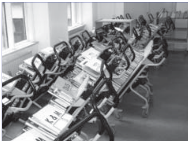
Een sorteermachine brengt de materialen snel naar hun juiste plaats.

De Kopenhaagse openbare bibliotheek was dan ook de eerste ter wereld die haar leden on line muziekbestanden kon aanbieden. Deze collectie omvat 3.000 muziekbestanden, voornamelijk klassieke muziek uitgegeven op Scandinavische of kleinere onafhankelijke labels. Via een speciaal ontwikkeld programma dat kopiëren of verzenden onmogelijk maakt, kunnen de bibliotheekgebruikers deze muziekbestanden een week lang opladen. Ondanks de blijvende terughoudendheid van de grotere muziekuitgeverijen, die deze dienstverlening beschouwen als een bedreiging voor de eigen inkomsten, zal deze collectie tegen september 2004 vertienvoudigd zijn en zal ook het aandeel van andere genres in het aanbod sterk toenemen. Volgens dezelfde logica krijgt de bibliotheekgebruiker ook toegang tot een uitgebreide collectie van on-linedatabases beheerd door diverse instellingen en organisaties.