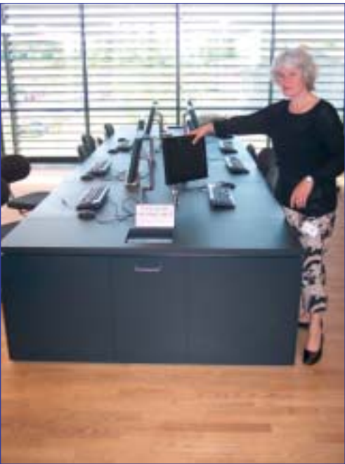
Alles is ontworpen om diefstal of beschadiging te vermijden.

Centraal staan drie verdiepingen (waarvan een kelderverdieping) met open rekken en lees- en studiehoeken. Aan het ene uiteinde liggen de administratieve functies, aan het andere uiteinde lokaaltjes met variabele functies: een projectiekamer met groot scherm, één voor het bekijken van microfilms, een computervrije studeerruimte met individueel af te sluiten opbergvakjes en leslokalen met pc's voor ondersteuning in informatieopzoeken. De totale oppervlakte bedraagt 7.600 m 2 , waarvan 4.500 m 2 voor de gebruikers bestemd is.