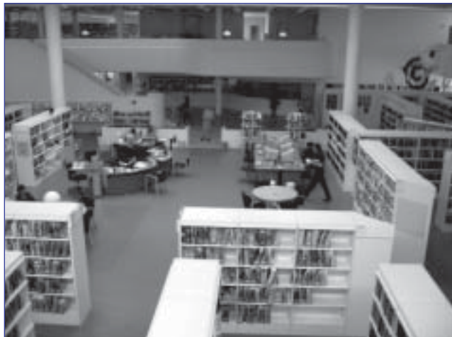
Een open structuur kenmerkt het interieur van Gentofte openbare bibliotheek.