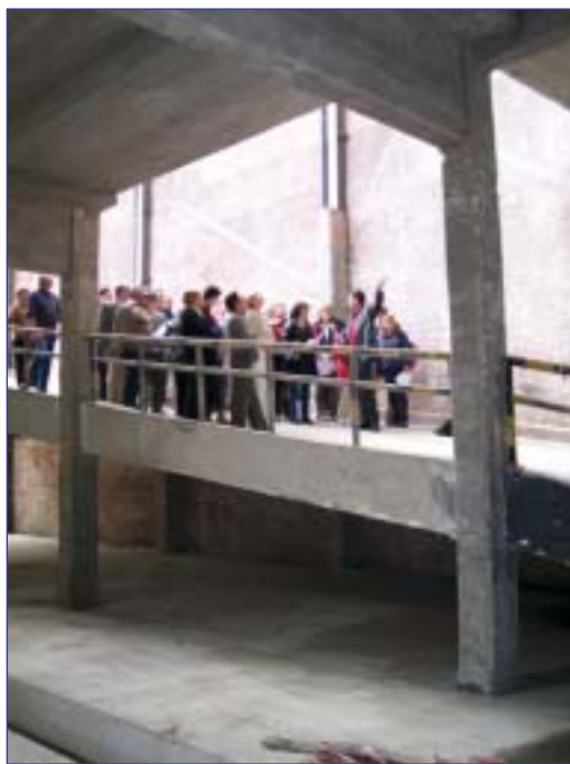
De bibliotheek staat in juni 2004 nog volop in de stellingen. Op 22 april 2005 opent ze haar deuren.