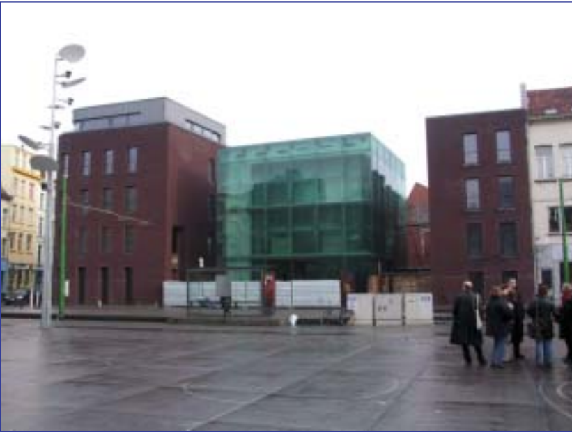
De Permeke-bibliotheek aan het De Coninckplein in Antwerpen. Toestand december 2003.