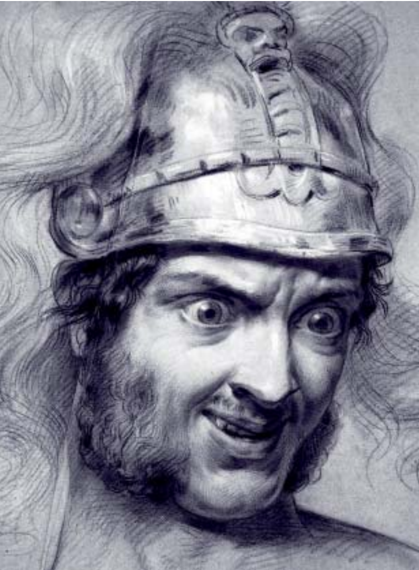
Hogeschool Antwerpen - Campusbibliotheek Mutsaard. Van Lerijs Jozef - Legaat: originele tekening, voorbeeld van uitdrukkingshoofden.