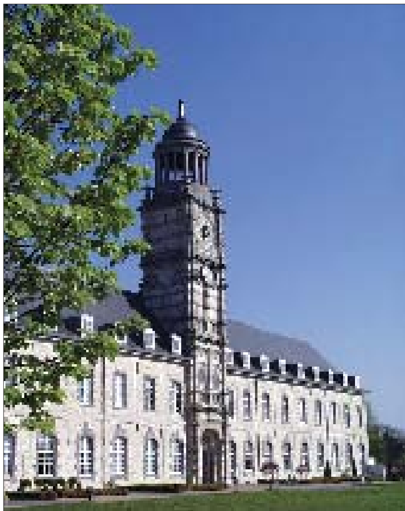
De fraai gerestaureerde gevel van de Sint-Bernardusabdij van Hemiksem, die uitgeeft op de Schelde.

Katlijn: Dé voorwaarde is dat de gemeenten het echt moeten willen. Zonder de onvoorwaardelijke steun van de gemeentebesturen heb je geen kans op slagen. Het is een zeer lange, intense periode waarbij je soms op eieren moet lopen. Pas als je alle problemen overwonnen hebt, kun je beginnen te denken aan de positieve gevolgen. Maar ik blijf erbij: samenwerken het is een absolute noodzaak voor kleine bibliotheken om goed werk te kunnen leveren.