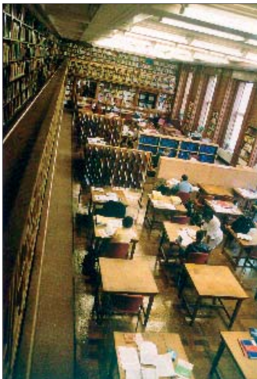
De London School of Economics and Political Science.

werkstations voor gebruikers. In de bibliotheek is er overigens één werkstation per 4 studenten, ruim boven de normen van de Library Association en boven het landelijke gemiddelde van 1 per 8 studenten.