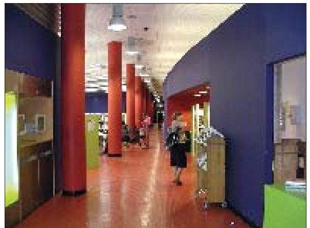
... en in de Idea Store Bow.

De meest verrassende en verfrissende 'bibliotheek' is wellicht de Idea Store van Bow, naast een supermarkt in een achtergestelde buurt. Sinds het ontstaan van deze 'Ideëenwinkel' in mei 2002 is het bezoekersaantal – 1.100 per dag – verviervoudigd ten opzichte van de 2 vroegere, klassieke bibliotheken van