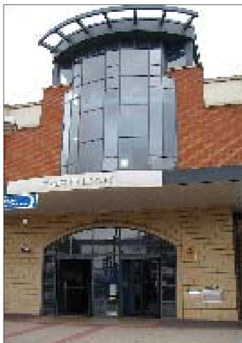
Stratford Library in Newham.

De dynamische benedenverdieping biedt plaats aan de centrale uitleenbalie, de audiovisuele materialen, de afdeling voor kinderen en adolescenten en een internetafdeling. Op de rustige eerste verdieping liggen een info-balie, de traditionele collecties voor volwas-