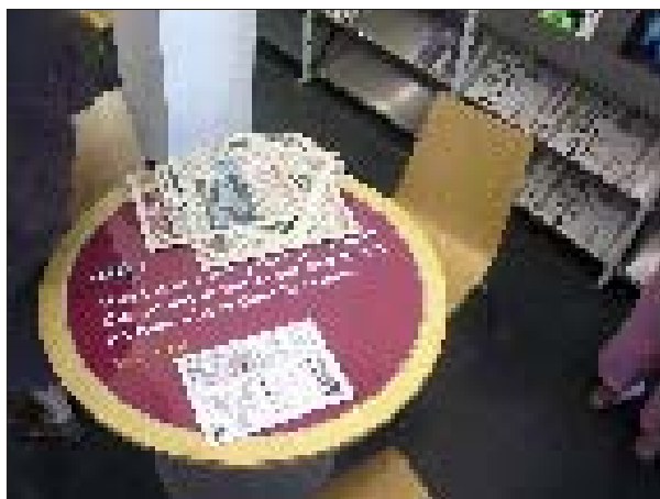
Een leestafel met een boodschap in Idea Store Bow.