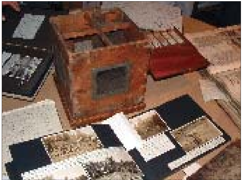
De London School of Hygiene and Tropical Medicine.

Londen telt 395 bibliotheken, 114 academi-