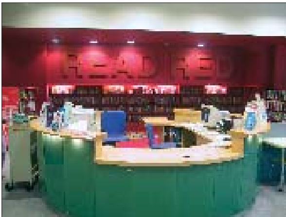
Kleur speelt een hoofdrol in Stratford Library...

senen, de leeszaal, werkruidtes, computers. De centrale traphal met lift en alle doorgangszones zijn helblauw. De uitleenbalie staat precies tussen de in- en uitgang, met beveiligingspoortjes. Het uitlenen gebeurt automatisch, er is voorlopig één zelfscanbalie. De functies of afdelingen zijn direct herkenbaar dankzij kleurrijke woordcollages op de wanden. De cd's, dvd's en video's zijn thematisch opgesteld en worden meestal frontaal gepresenteerd. Ook taalcursussen, playstation- en andere games worden uitgeleend. In deze populaire zone staan ook enkele rekken op wielen met populaire boeken en enkele gesponsorde standen (van een uitgever) met dvd's, cd's en boeken. De 'teenzone' omvat een internetafdeling, een zithoek met tv en enkele rekken op wielen, met sobere signalisatie. Er is een doorsteek naar het hippe leescafé 'Mondo', dat ook rechtstreeks van op de straat bereikbaar is.