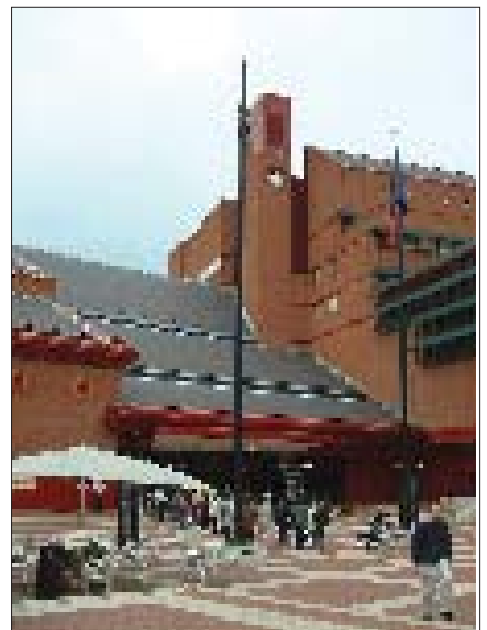
De British Library. Foto: VVBAD.

Eén van de grootste uitdagingen voor een bewaarbibliotheek is het archiveren en degelijk bewaren van elektronische bronnen. Migraties naar nieuwe formaten gebeuren steeds op basis van het origineel. Hiervoor wordt samengewerkt met andere nationale bibliotheken. De BL wil ook alle websites in het UK-domein archiveren en bewaren. Naast technische levert dit ook copyright-problemen op: de BL is nog niet uit hoe zij dit moet