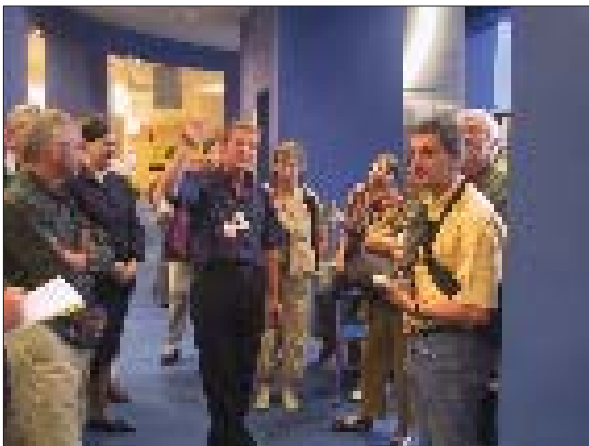
Het gezelschap in Stratford Library.

Een bezoek aan CILIP, de zusterorganisatie van de VVBAD, beet de spits af ( www.cilip.org.uk ). CILIP is ontstaan in 2002 als een samenvoeging van The Library Association en The Institute of Information Scientists. Anders dan de VVBAD richt CILIP zich enkel tot bibliotheek- en documentatiepersoneel en niet tot archivariissen. CILIP heeft 25.000, meestal individuele, maar ook institutionele leden uit verschillende sectoren: school- en openbare bibliotheken, documentatiediensten in bedrijven en overheidsdiensten... Naast de 70 personeelsleden kan CILIP, net als de VVBAD, rekenen op vrijwilligers-bibliothecarissen. De inkomsten komen hoofdzakelijk uit lidmaatschapsbijdragen maar ook uit nevenactiviteiten: consultancyopdrachten, advertenties in het tijdschrift Update , activiteiten als tewerkstellings- en bemiddelingskantoor voor bibliotheekfuncties en vakgerichte opleidingen.