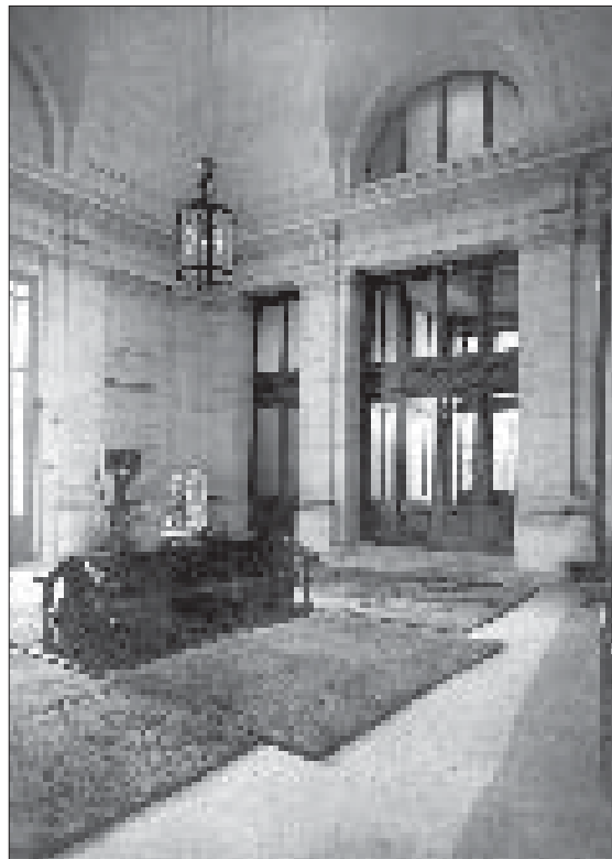
De inkomhal aan de Leuvensesteenweg (zaal 11) vóór het aanbrengen van de marmerbekleding in de jaren 1930.

Afrikazaal' werd later ook een diorama aangebracht met nagebouwde hutten en menselijke figuren in traditionele klederdracht, wat de collectie aanschouwelijker en aantrekkelijker moest maken. Een soortgelijke inrichting als in zaal 5 – met in de wanden ingebouwde vitrines – werd gerealiseerd in het zogenaamde juwelenzaaltje (zaal 6), waar Afrikaanse juwelen getoond werden en dat tegelijk dienst