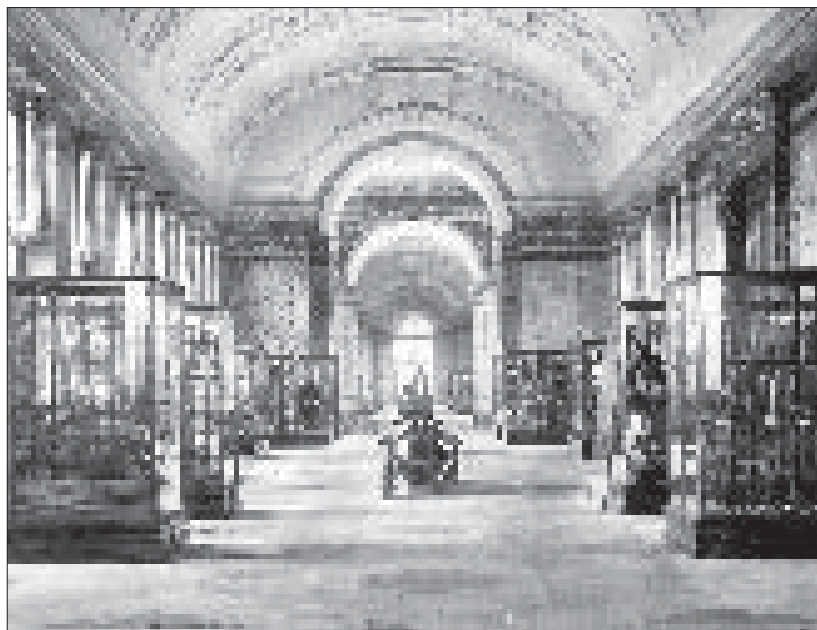
De huidige zaal 2, kort vóór de opening in 1910. Centraal op de foto de houten zitbanken waarvan nu nog enkele exemplaren te zien zijn in het museum.

Museumgidsen zijn interessante informatiebronnen om iets te achterhalen over de inrichting en de ideologie van het museum in een bepaalde periode 7 . Een eerste beperkte bezoekersgids van het museum van Tervuren verscheen in 1910, als laatste hoofdstuk van de publicatie Le Musée du Congo Belge à Tervuren . Het boekje is van de hand van de eerste directeur van het nieuwe museum, Alphonse de Haulleville, en beschrijft voor het grootste deel de