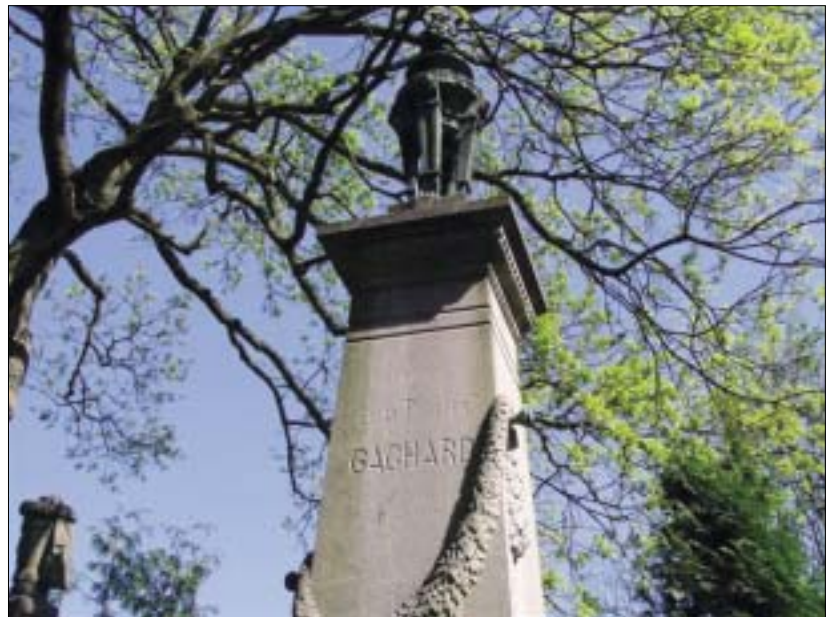
Grafmonument van Gachard op het kerkhof te Evere.

Deze tendensen ten spijt en ondanks de oprichting van de rijksuniversiteiten van Gent, Luik en Leuven (1816), bleef veel historisch werk van een schamele kwaliteit. In wezen kwamen die studies immers tot stand door " verlichte amateurs en sterk litterair georiënteerde geschiedschrijvers " 70 , gecultiveerde autodidacten of geleerden met een juridische achtergrond, met veel overtuiging, maar meestal zonder veel methode 71 , die kritiekloos mythes