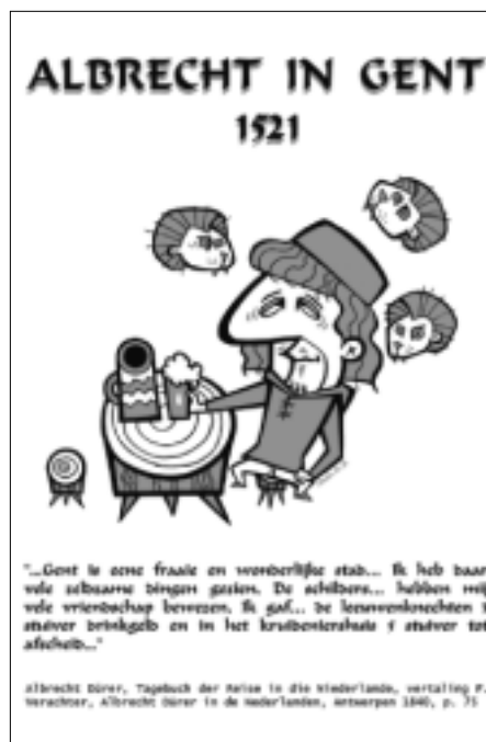
Een groots werk van ontbloting?

De tweede editie van het Erfgoedweekend volgde in april 2002. Toen werd de erfgoedgedachte vanuit het museum-