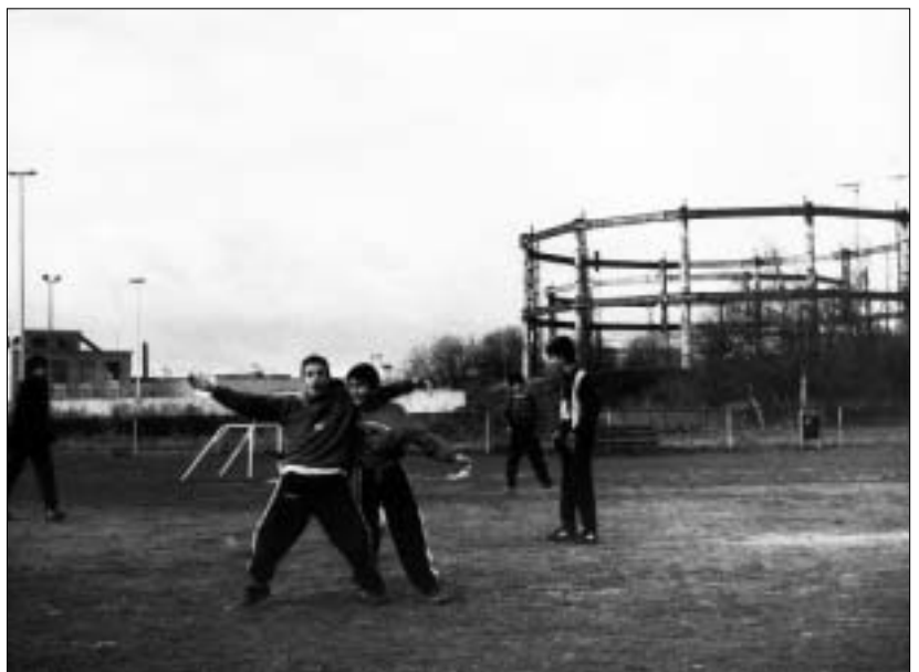
Gentse stadsgezichten.

Het vertrekpunt van de Erfgoedcel Gent vormt niet de zorg over een collectie, maar wel de bekommernis om collecties, gebouwen, sites, verhalen, te ontsluiten, (nieuw) leven te geven. Deze opdracht is complementair aan die van onder andere de archieven, wil geen expertise vervangen maar veel meer potenties aanzwengelen en initiatieven stimuleren.