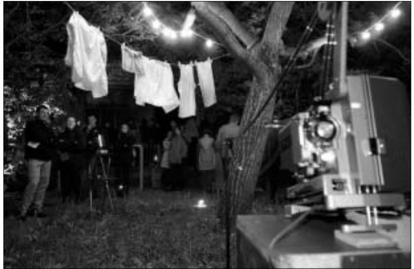
Erfgoedweekend 2001: ontdek mijn verleden.

De archieven spelen als cultuurgerichte organisaties een draaischijffunctie in een actief erfgoedbeleid. Ze kunnen immers een rol vervullen op het vlak van materieel én immaterieel erfgoed; geven verhalen aan talrijke objecten, plekken, gebouwen; kunnen actief verhalen gaan verzamelen; bewaren een belangrijk deel van het (te activeren) geheugen van een maatschappij; dragen zorg over interessant iconografisch materiaal; documenteren en onderzoeken de maatschappij tot en met haar actuele componenten.