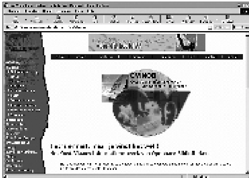
Het startscherm van Ovinob.

Het integreren in Ovinob en in Winob – telkens zowat 50 tot 60 bibliotheken – gebeurde behoedzaam en planmatig, met voortdurende inspraak – directe betrokkenheid – van alle part-