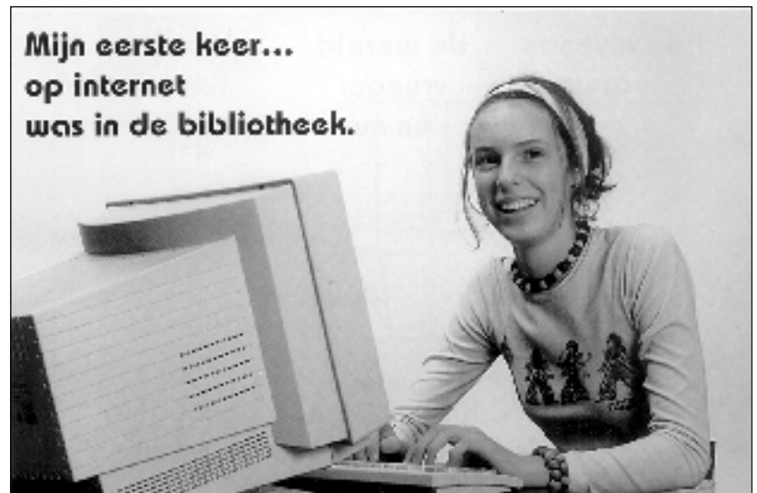
Eén van de vele aantrekkelijke affiches waarmee de POB van Middelkerke haar diensten ludiek in de kijker stelt.

4. Van het VCOB en de provincie verwacht ik veel. Ik zou het mooi vinden als we vanuit onze lokale catalogus naadloos kunnen doorklikken naar centrale catalogi, auteursinfo, recensies... Ik zou graag zien dat