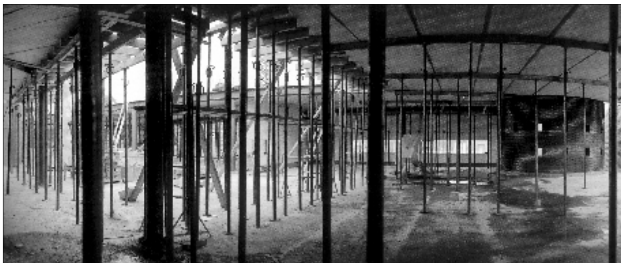
Aan het nieuwe decreet werd jarenlang flink gebouwd. Nu het in de stellingen is gezet, staat de afwerking op het programma. Bron: Jef Buytbeier, Boekstenen . - Harelbeke, Openbare Bibliotheek Harelbeke, 2001.

ren in het lokale culturele werkveld. In december 2000 werden er ook drie voorontwerpen van decreet bekendgemaakt. In een volgende fase zouden die tot een definitief voorontwerp samengevoegd worden.