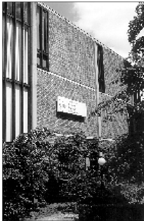
De Provinciale Centrale Openbare Bibliotheek Limburg.

5. Openbare bibliotheken zouden de motor moeten zijn van elk lokaal geïntegreerd cultuurbeleid, misschien zelfs nog meer dan de culturele centra. Een bibliotheek is in principe immers de instelling bij uitstek die oog heeft voor alle aspecten van cultuur in de samen-